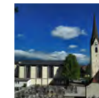
Pfarrkirche Mariä Heimsuchung römisch-katholisch Rheinstraße 5, 6800 Feldkirch-Nofels www.pfarre-nofels.at

17:00-22:00 Wolfgangskapelle geöffnet | Die Kapelle St. Wolfgang ist den ganzen Abend geöffnet und beleuchtet. Zur Ruhe kommen – Kerze anzünden – Stille.