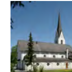
Stadtpfarrkirche zum hl. Sebastian römisch-katholisch Sebastianplatz 5, 6800 Feldkirch-Gisingen

18:00-19:00 Pfarrhausbesichtigung – Sebastianplatz 5 | 1904 wurde dieses Haus für den jeweiligen Gisinger Pfarrer erbaut.