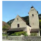
St. Magdalenenkirche römisch-katholisch Reichsststraße 113, 6800 Feldkirch-Levis